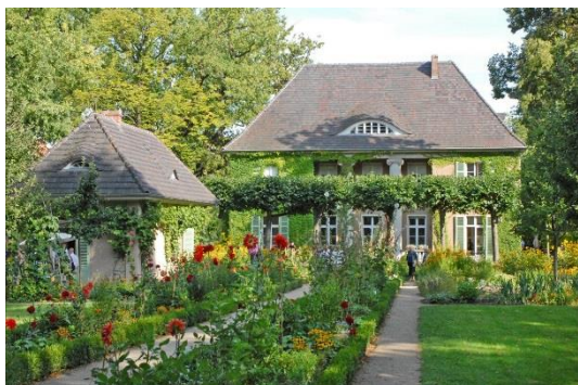
Max Liebermann Wannsee

Nach der Mittagspause Transfer zum Flughafen Tegel und Rückflug nach Zürich.